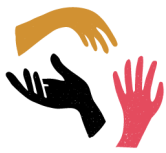
Table de quartier